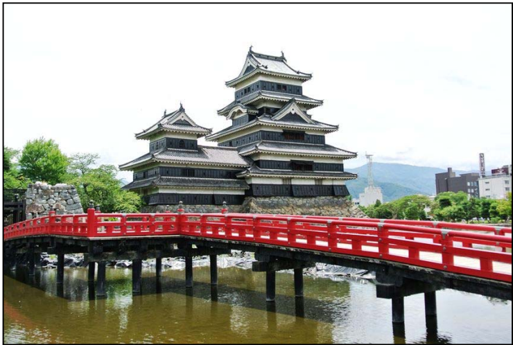
国宝松本城見学 時間が足りませんでした