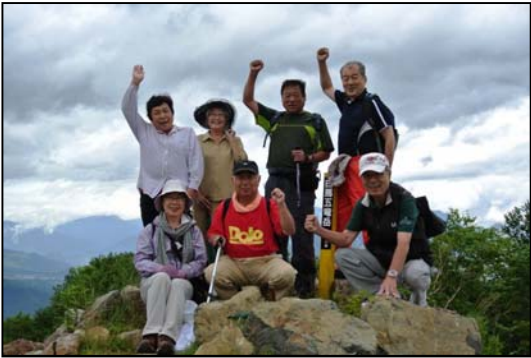
白馬五竜岳山頂にて