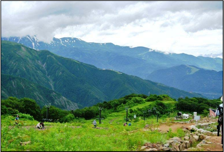
五竜山野草園からの眺望 野草ガイド付のトレッキングを楽しみました