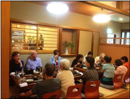
香林亭大宴会 この後スノーハーブでホテル観賞