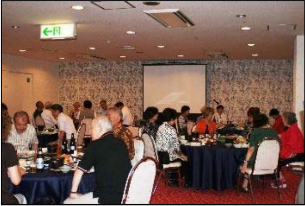
安曇野ビューホテル懇親会 温泉入浴を楽しみました