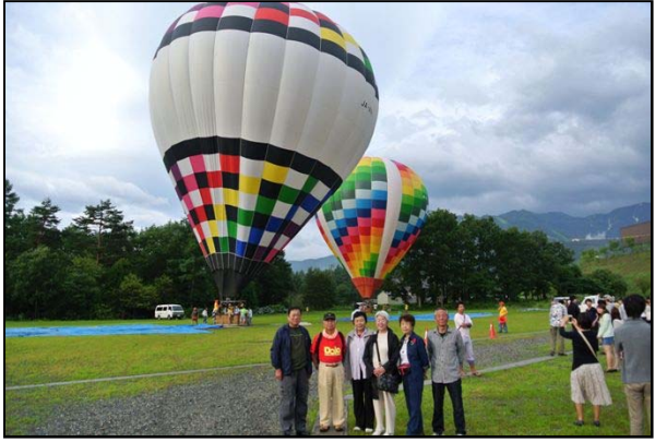
白馬ジャンプ場で熱気球体験 天候に恵まれ快適な空の旅でした