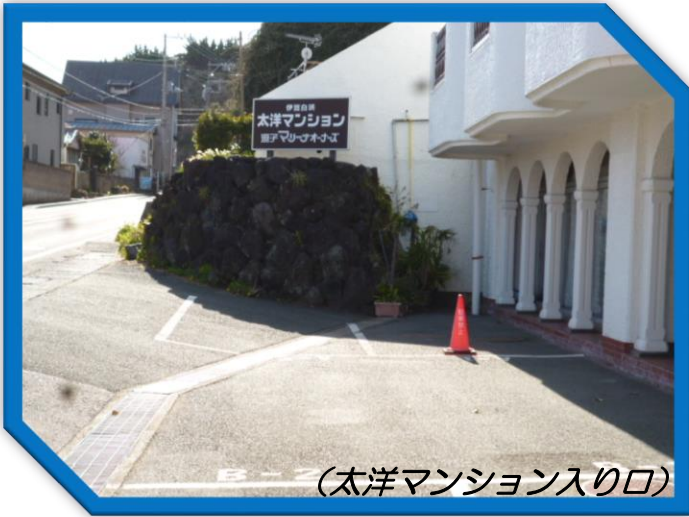
(太洋マンション入り口)